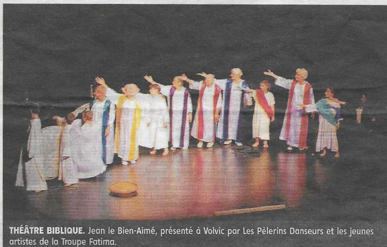
THÉÂTRE BIBLIQUE. Jean le Bien-Aimé, présenté à Volvic par Les Pèlerins Danseurs et les jeunes artistes de la Troupe Fatima.